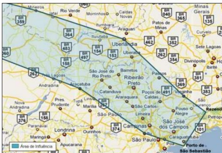
Figura 3: Hinterlândia do Porto de São Sebastião