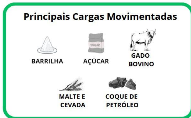
Figura 2: Cargas movimentadas no Porto de São Sebastião

De acordo com o PDZ do Porto de São Sebastião, todas as áreas de armazenagem e de movimentação estão destinadas para cargas multipropósitos, o que viabiliza a possibilidade de movimentar todos os tipos de cargas, o que demonstra a versatilidade do bem público e a viabilidade para todo o tipo de operação no ecossistema portuário. As principais cargas movimentadas no Porto, no ano de 2024, podem ser observadas na figura 2 a seguir: