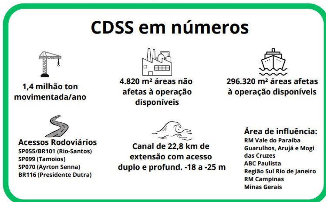
Figura 1: Características gerais do Porto de São Sebastião

O Porto de São Sebastião vem se consagrando como importante elo da cadeia logística. Seus crescentes resultados demonstram o comprometimento da gestão e de seus colaboradores em prestar serviços adequados para que o Porto se consolide como destaque no setor portuário.