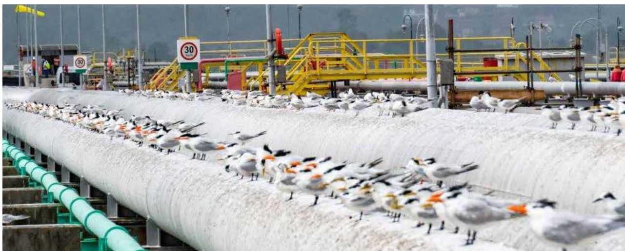
FIGURA 11: Ninhai de gaivotinhas trinta-réis ( Charadriiformes: Laridae ) no Tebar.

Nesse contexto, e para atender às condicionantes de sua licença ambiental, a CDSS elaborou o Plano de Gestão Ambiental (PGA), aprovado pelo Ibama. O documento reúne todas as ações e monitoramentos ambientais realizados no Porto, visando promover a conversação ambiental.