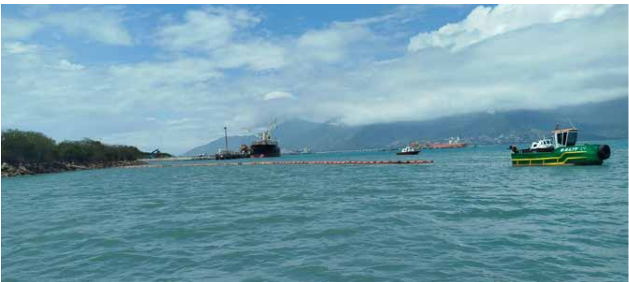
FIGURA 20: Exercício do Centro de Atendimento a Emergências - CEATE- do Porto de São Sebastião, com recursos materiais e humanos à disposição 24h por dia, 365 dias por ano.