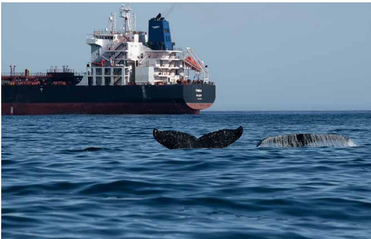
FIGURA 22: Grupo de jubartes avistado no Canal de São Sebastião, próximo a rotas de navios que operam com o Porto e com o Tebar.