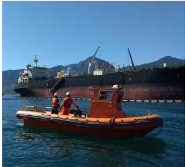
FIGURA 21: Treinamento do Centro de Resposta a Emergências - CRE - do TEBAR, com recursos materiais e humanos à disposição 24h por dia, 365 dias por ano.

em tempo real, utilizando uma rede integrada de sensores e instrumentos meteoceanográficos instalados pela Transpetro ou por outros órgãos públicos e privados. Esses protocolos estabelecem os procedimentos e ações para responder de forma antecipada e segura a eventos naturais extremos.