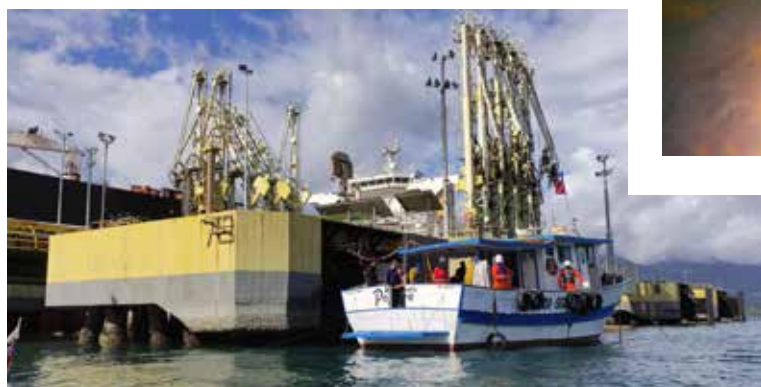
FIGURA 10A-C: Manejo de coral-sol ( Tubastraea spp. ) nas instalações.