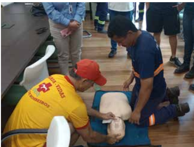
FIGURA 15: Capacitação da força de trabalho em primeiros socorros.