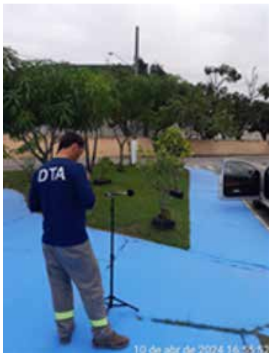
FIGURA 4: Amostragem de ruído ambiental nas instalações.