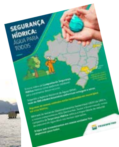
FIGURA 6: Cartaz sobre segurança hídrica exposto nas instalações.