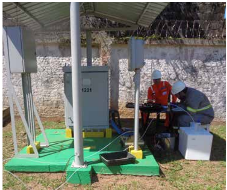
FIGURA 8: Amostragem de água subterrânea.