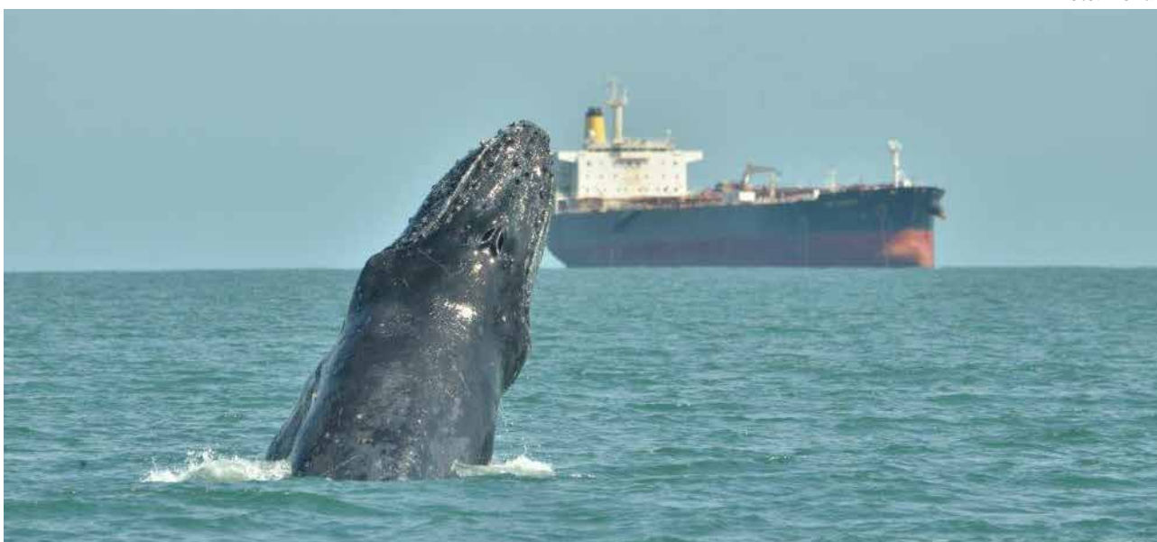
FIGURA 14: Jubarte avistada no Canal de São Sebastião, próxima às rotas dos navios.