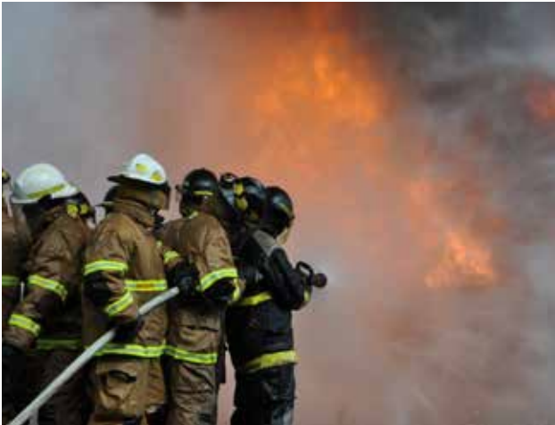
FIGURA 17: Treinamento da Brigada de Emergência do TEBAR.

constantes, mantendo-se aptas a responder prontamente em caso de emergência. Além disso, o Tebar promove simulados de campo internos, corporativos e locais, que exploram os diferentes cenários emergenciais previstos nos planos de contingência;