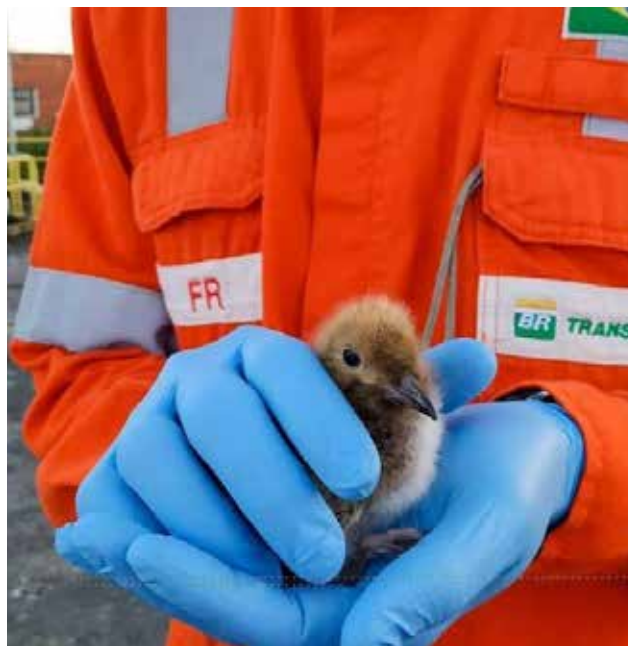
FIGURA 13: Manejo de fauna silvestre nas instalações.