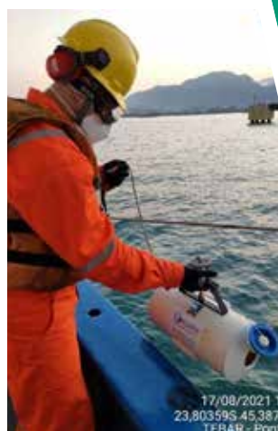
FIGURA 7A-B: Coleta de amostras para análise de qualidade da água e sedimento marinhos durante o monitoramento do Canal de São Sebastião.