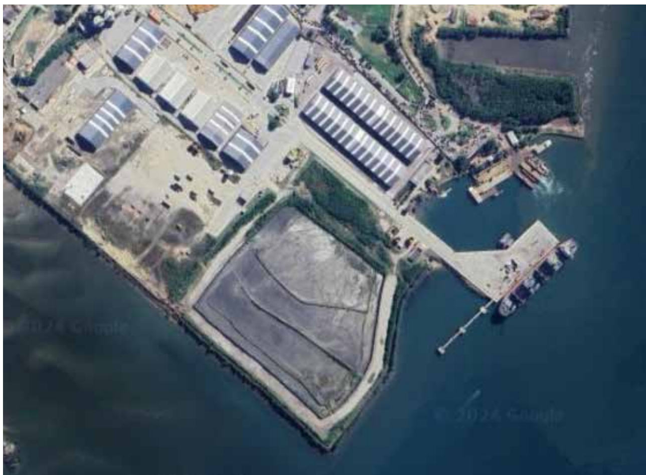
FIGURA 1: Porto de São Sebastião, administrado pela Companhia Docas de São Sebastião do Governo do Estado de São Paulo (SEMIL)

A movimentação de carga no Porto de São Sebastião atinge cerca de 800 mil toneladas anuais, com predominância de operações de importação de barrilha, sulfato de sódio, ulexita, malte e cevada, além de operações de exportação de silicato de vidro, açúcar em saco e gado vivo. O Porto realiza um amplo e complexo programa de monitoramento ambiental, que abrange tanto as instalações quanto o entorno do porto, como o Canal de São Sebastião, a Enseada do Araçá, trechos