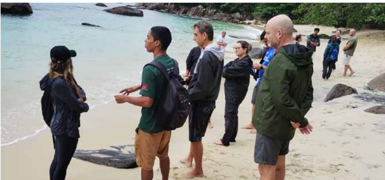
FIGURA 16: Programa de Educação Ambiental do Porto de São Sebastião.