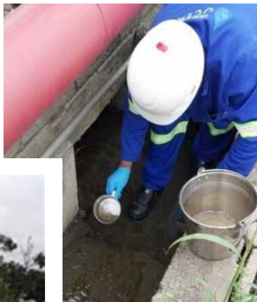
FIGURA 3: Coleta de amostras de efluentes industriais.