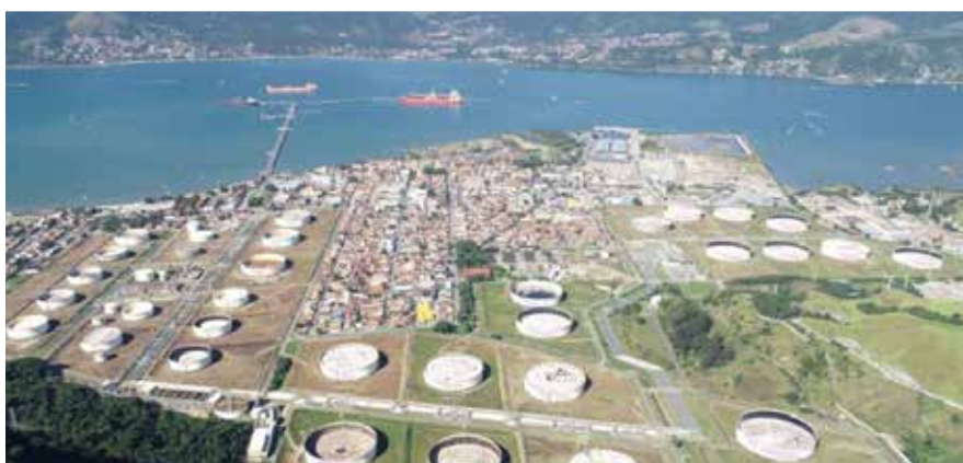
FIGURA 2: Terminal Marítimo Almirante Barroso – Tebar operado pela Transpetro em São Sebastião-SP.