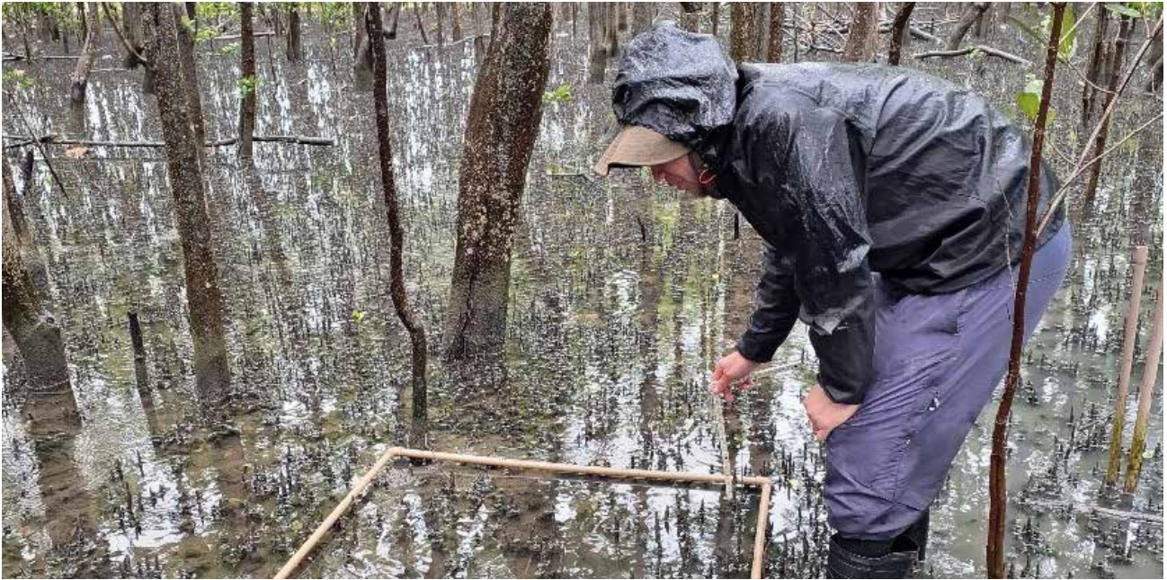
FIGURA 12: Monitoramento de ambientes naturais na área do Porto Organizado (Manguezal).