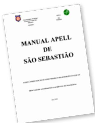
FIGURA 19A: Manual APELL - Alerta e Preparação de Comunidades para Emergências Locais - de São Sebastião.

A preparação e resposta a emergências pode ser definida como o conjunto de estratégias, recursos, procedimentos e ações implementados para prevenir, mitigar e responder de maneira eficiente a incidentes que possam causar impactos adversos ao meio ambiente marinho. Entre esses incidentes, destacam-se vazamentos de óleo, derramamentos de substâncias químicas perigosas ou outros eventos que possam ameaçar a biodiversidade e os ecossistemas aquáticos.