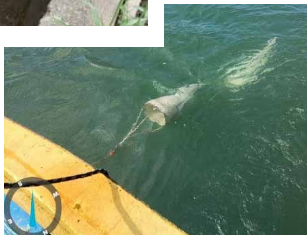
FIGURA 5: Coleta de amostras para análise da biota durante o Monitoramento do Canal de São Sebastião.